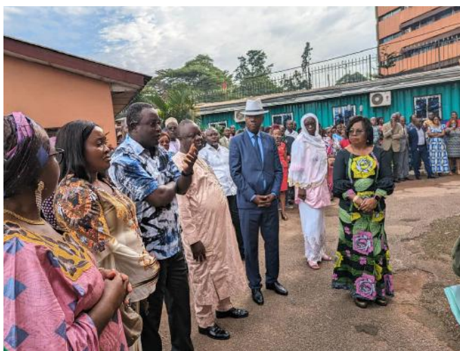
Séance d'échanges sur les valeurs patriotiques liées au drapeau national

C'est à 7h30 précises que le Ministre Nalova Lyonga est arrivée à l'esplanade avant de son département ministériel ce mercredi 15 mai 2024. Avant d'entamer sa journée de travail, elle a tenu à saluer le drapeau tricolore en compagnie de ses collaborateurs. Cette cérémonie fait suite au communiqué n° 412/2024 du 10 mai 2024, du Ministère de la Jeunesse et de l'Éducation Civique, étendant les cérémonies de levée des couleurs dans toutes les administrations publiques afin de consolider l'unité nationale. Elle rentre dans le cadre des activités civiles marquant la célébration de la 52ème édition de la Fête de l'Unité et dans la perspective de magnifier l'unité et le vivre-ensemble harmonieux à travers la valorisation des symboles et emblèmes de la République.