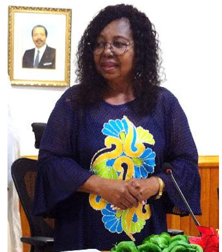
Le MINESEC exprimant sa satisfaction

Il est doté d'une grande salle de réunion et de trois toilettes modernes, dont une VIP. La grande salle de réunion est équipée de toutes les infrastructures