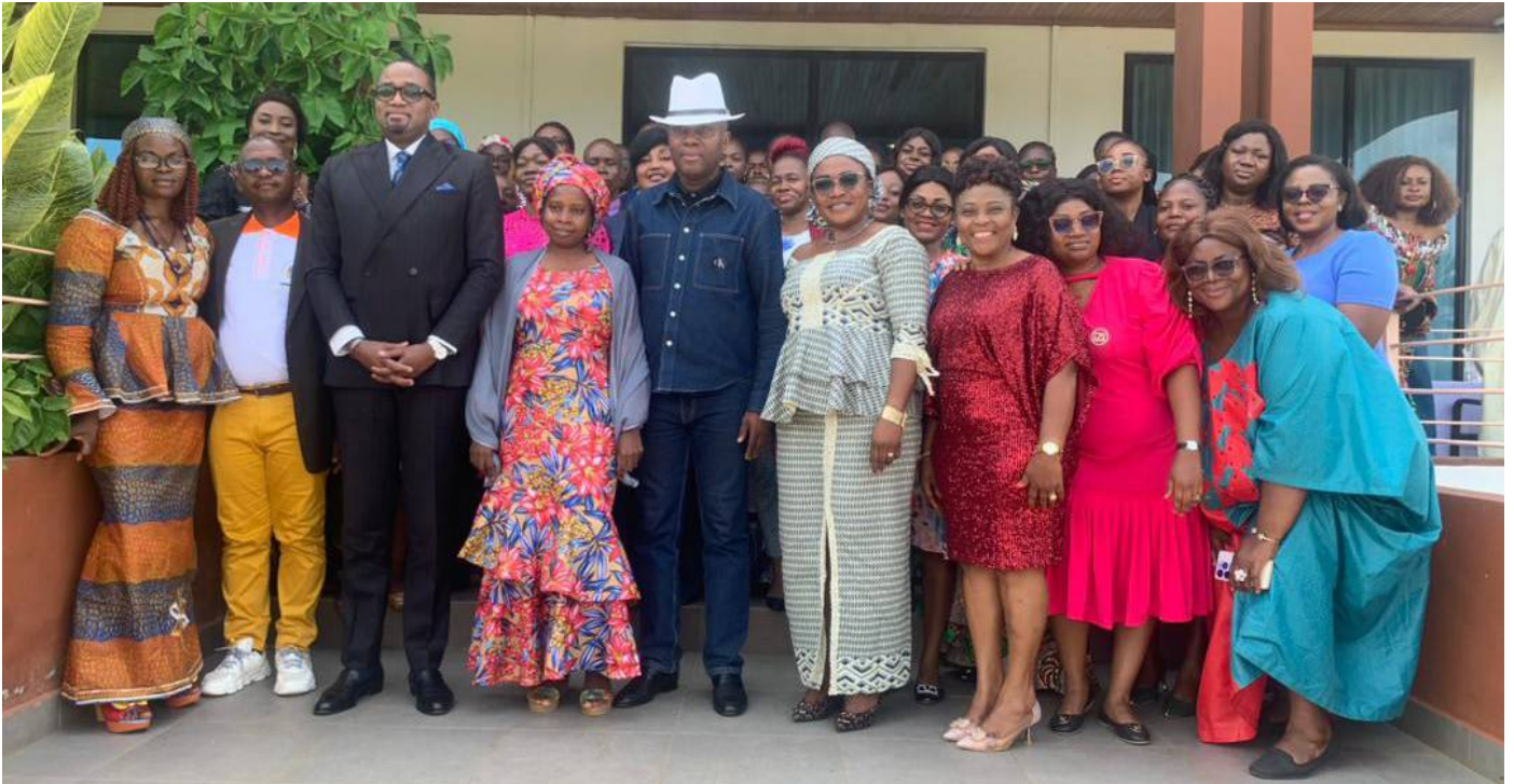
Le SG du MINESEC (au centre) entouré des participants au séminaire

Un séminaire de renforcement de capacités des secrétaires, agents de liaison et personnels du courrier du MINESEC a eu lieu le 11 mai dernier à l'hôtel MUNDI à Yaoundé. Ceci dans l'optique de redynamiser les performances de ce personnel dans la gestion du courrier et des dossiers.