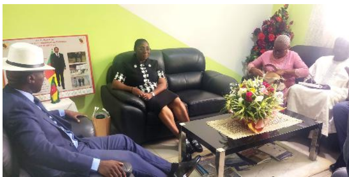
Le Préfet de la Mefou-et-Akono avec ses hôtes du MINESEC

le Lycée d'Oveng-Mbankomo, le Lycée Bilingue de Mbankomo et le Lycée Technique de Mbankomo.