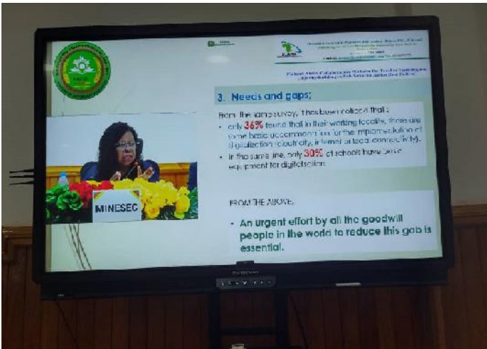
MINESEC's presentation via Zoom