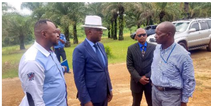
Bref entretien entre le Secrétaire Général et le Chef de secrétariat du Probatoire Technique au Lycée technique de Ngoumou

Le Secrétaire Général et sa suite sont rendus ensuite au Lycée Bilingue de Mbankomo, hôte de deux centres d'examens, celui du Baccalauréat ESG et celui du GCE-Ordinary et Advanced Levels, avant de terminer leur mission au Lycée Technique de Mbankomo, sous-centres d'examens du Probatoire des Brevets des techniciens et des Probatoires F. Ici également, tout est bien coordonné pour la prise en charge adéquate et régulière des candidats.