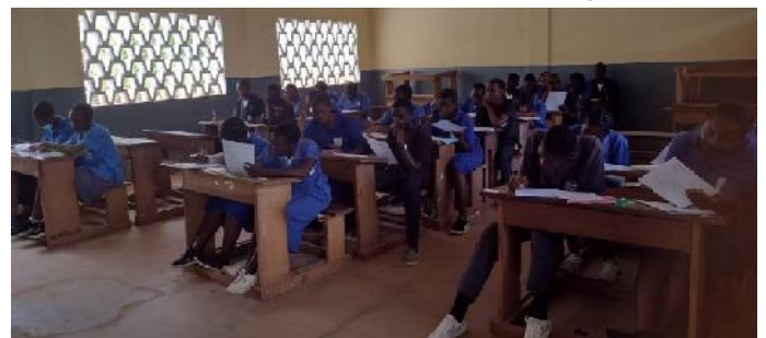
Candidates concentrated on their exam paper

Overall, the visit to the three schools in Yaounde provided a valuable insight into the administration of BEPC and CAP examinations, with the officials noting that the exams were being conducted in a fair and transparent manner as various centre heads took their responsibilities seriously.