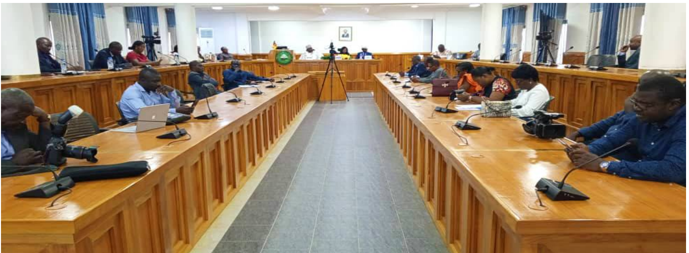
A glimpse of the Conference room at the distance Education Centre

This facility highlights the expertise and know-how of Cameroonian secondary school teachers in Industrial Technical Education.