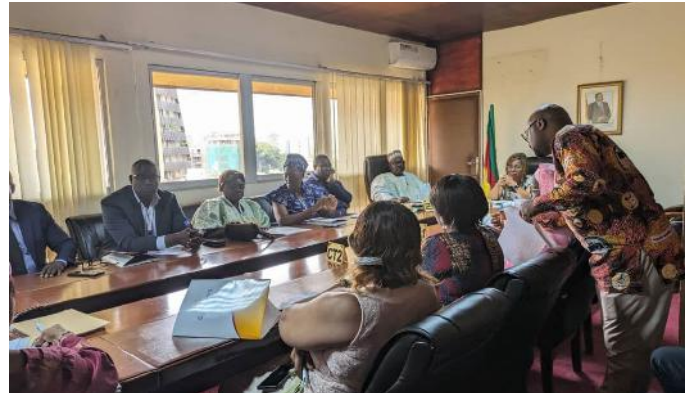
Working session between MINESEC’s and Sightsavers’ officials

This audience was an opportunity for both parties to make an appraisal of the achievements attained thus far. The Inspector-Coordinator General in charge of Teachers’ Training, pilot of the implementation of inclusive education in the Ministry