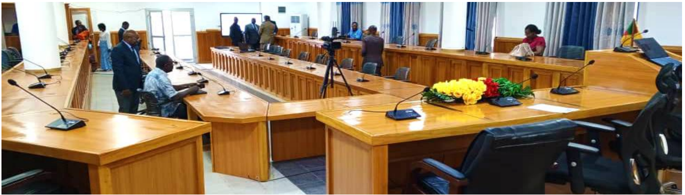
Une vue de la salle de conférence

nécessaires pour garantir le bon déroulement des événements, notamment des équipements audiovisuels de pointe et une loge pour les techniciens audiovisuels.