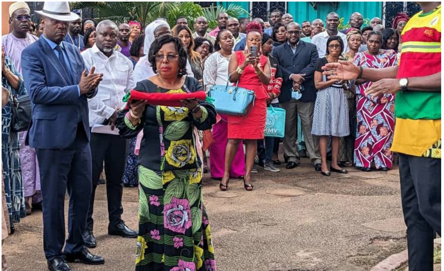
Le MINESEC portant fièrement le drapeau