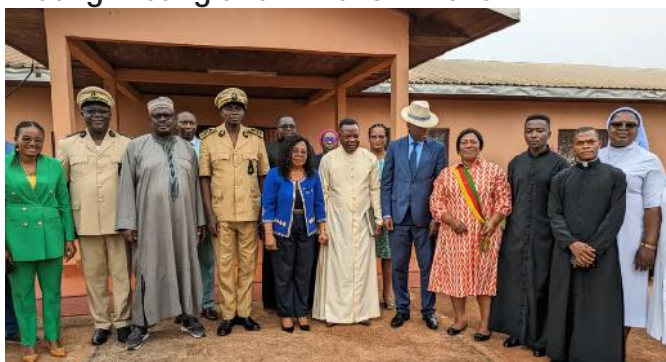
Authorities of the East Region and MINESEC officials