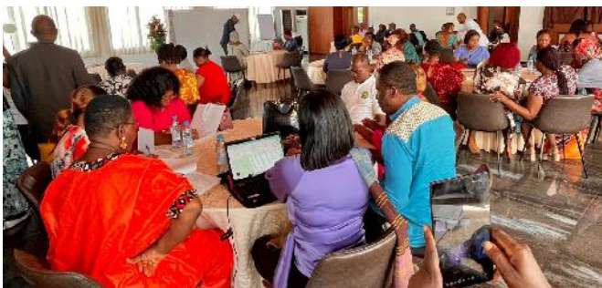
Travaux en atelier

À l'entame de cette formation, les participants ont été invités à présenter leurs attentes de ce séminaire afin de mieux diriger les exposés et les échanges. Dans son discours d'ouverture, le Secrétaire Général du MINESEC a tenu à souhaiter la bienvenue à tous les membres présents, à réitérer les aspirations de Madame le Ministre par rapport à cette formation et à présenter les différents groupes de participants avant de donner la parole aux intervenants.