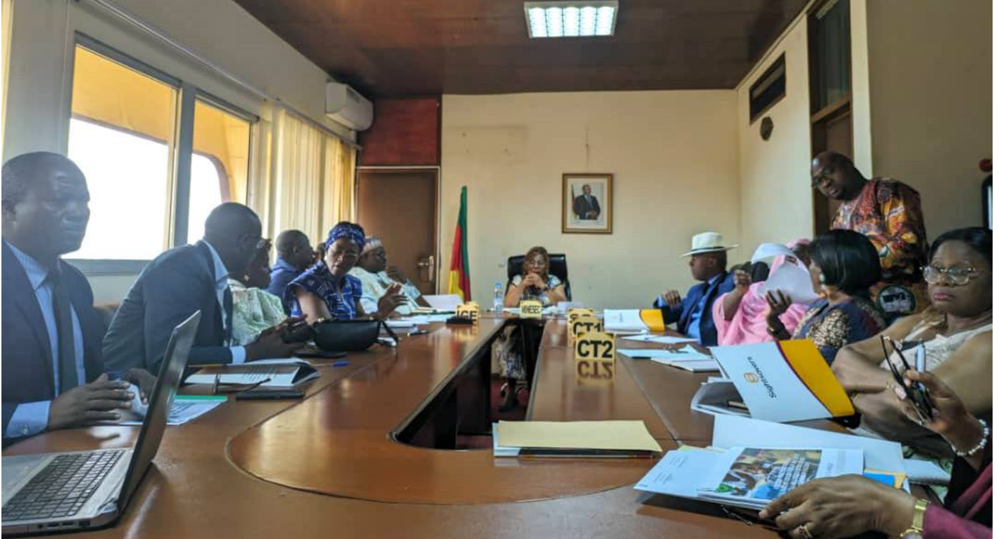
A view of the working session between MINESEC's and Sightsavers' officials