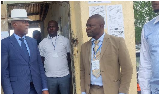
Le Secrétaire Général du MINESEC au sous-centre d'examen du Baccalauréat au Lycée général de Ngoumou