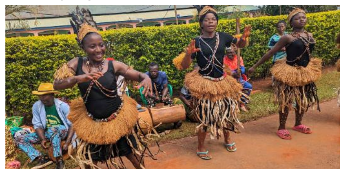
Traditional dancers welcoming MINESEC