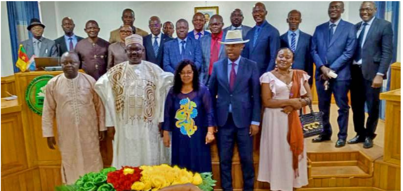
Photo d'inauguration officielle

Le mercredi 05 juin 2024, les responsables du Ministère des Enseignements Secondaires ont assisté à la mise en service de la nouvelle salle de conférence du Centre d'Éducation à Distance au cours d'une inauguration présidée par le Ministre des Enseignements Secondaires, Professeur Nalova Lyonga.