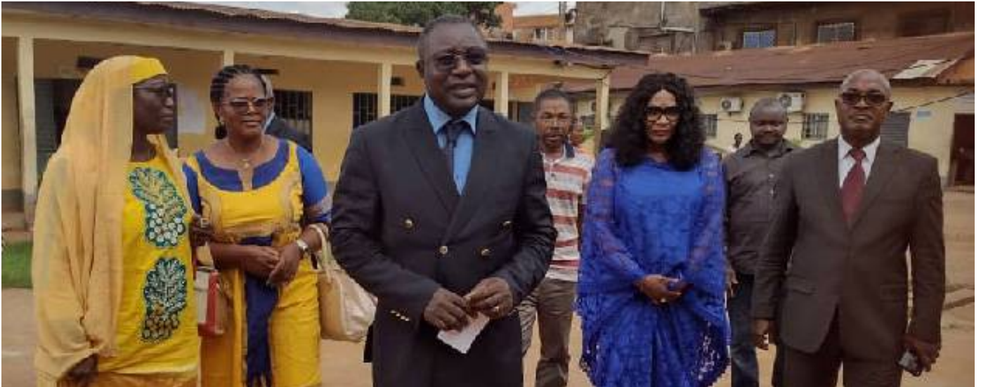
The Inspector General of Education on the field