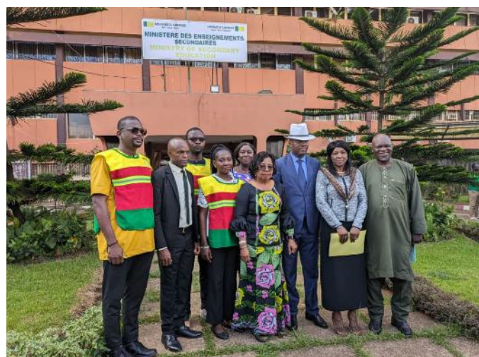
Le MINESEC et les émissaires du MINJEC

Le personnel du service civique, à travers un exposé à l'attention du personnel du MINESEC, a tenu à rappeler l'importance des symboles et emblèmes de la République et a donné quelques recommandations pratiques autour de ces symboles. Par la suite, les responsables du MINJEC ont fait don d'un drapeau du Cameroun au Ministère des Enseignements Secondaires, reçu par Madame le Ministre. Une série de questions-réponses a alors mis un terme à cet évènement.