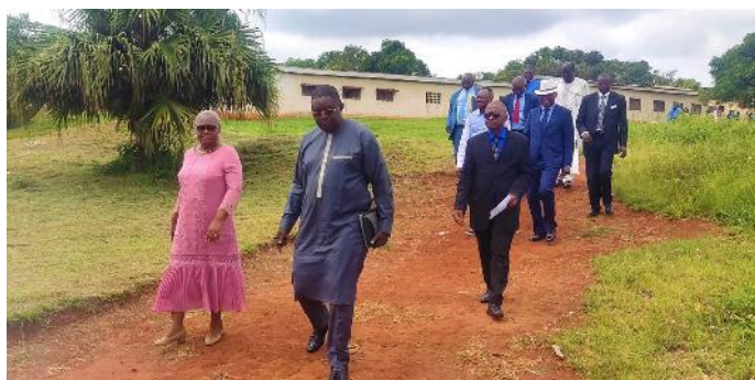
La délégation du MINESEC sur le terrain au Lycée Bilingue de Ngoumou

Rappelons que quatre autres équipes de mission commises par le Ministre des Enseignements Secondaires, le Professeur Nalova Lyonga, sont à pied d'œuvre dans les autres neuf Régions du pays pour la même cause.